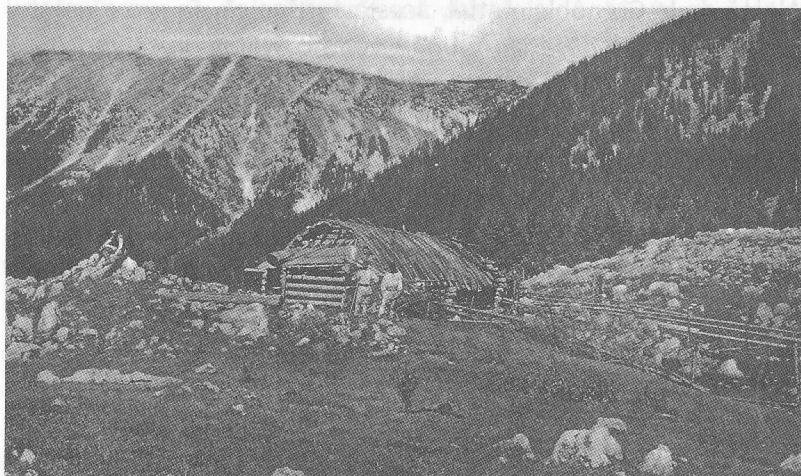
Stâna Zănoaga

Zărnești încă este designată principial să adăpostească în zona ei superioară o întinsă rezervățiune alpină, de sute de jugăre. Direcțiunea Grădinii Botanice a încheiat și un proces în această privință. Aci flora deosebit de bogată merită să fie scoasă de sub nemilosul regim pastoral. Numai aci crește garoafa Dianthus callizonus ." În 1963, Consiliul de îndrumare pentru ocrotirea naturii din județul Brașov a propus să se rețină în Piatra Craiului anumite zone de la pășunat „deoarece în acest masiv presiunea pășunatului a împins caprele negre în locuri cu o capacitate de hrănire complet necorespunzătoare, iar turismul a împânzit cu drumuri de acces și această stațiune”. Preluând mai multe date din bibliografia științifică, Emilian Cristea sublinia în monografia sa că „pe versanții orientați spre soare, cunoscuți sub numele local de „Fața Pietrei”, vegetația este încă prejudiciată din cauza pășunatului turmelor de oi, extins de la poale până pe creastă. Din această cauză, în partea estică a rezervației (instituită în anul 1938), elementele specifice de floră și faună sunt mult mai rare decât pe versanții opuși. Degradarea și distrugerea acestora ar putea fi evitate prin interzicerea strictă a pășunatului în zona ocrotită a versantului estic.”